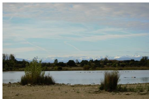
Un Canard à crinière se cache au milieu des Oies cendrées sur fond de montagnes enneigées

-saient le « show » avec un Héron cendré et une Aigrette garzette en pleine pêche juste devant l'observatoire du Gorgebleue. Juste avant de rejoindre l'observatoire forestier du Pic vert et ses nombreux nichoirs sur lesquels les Lézards des murailles étaient plus nombreux que les oiseaux, un Martin-pêcheur d'Europe se laissa contempler plusieurs minutes dans la longue-vue. Assez peu d'oiseaux migrateurs pour cette journée, mais néanmoins une belle diversité qui a ravi tous les observateurs.