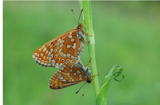
Damier de la Succise