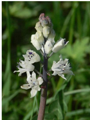
Jacinthe de Rome