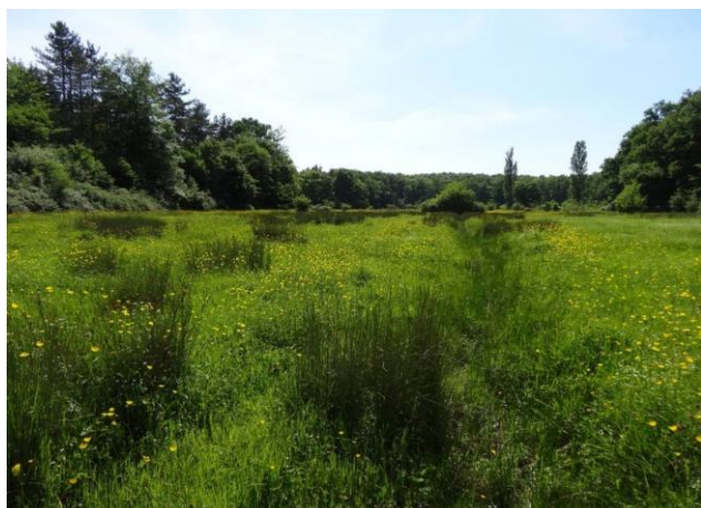
Prairie du Pesquié en début d'été